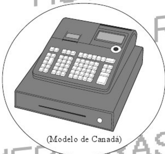
(Modelo de Canadá)